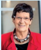
Prof. Dr. Rita Süßmuth

Autor und Gründer des Zukunftsinstituts in Frankfurt und Wien. Er beschäftigt sich mit Themen wie z.B. „Megatrends“, „Zukunft ist gelungene Beziehung“ oder „Anleitung zum Zukunftsoptimismus“.