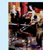
Mittwoch Finest Jazz Ensemble