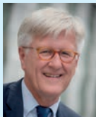
Prof. Dr. Heinrich Bedford-Strohm

Bundestagspräsidentin a.D.. Ihre Arbeitsschwerpunkte liegen in der Familien-, Frauen- und Kinderforschung.