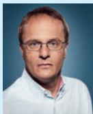
Prof. Dr. Markus Hengstschläger

Gründerin und Inhaberin von Future Impacts Consulting. In den letzten Jahren waren ihre inhaltlichen Schwerpunkte die Zukunft der Arbeit, der Energie, Mobilität, Ernährung und des gesellschaftlichen Wandels.